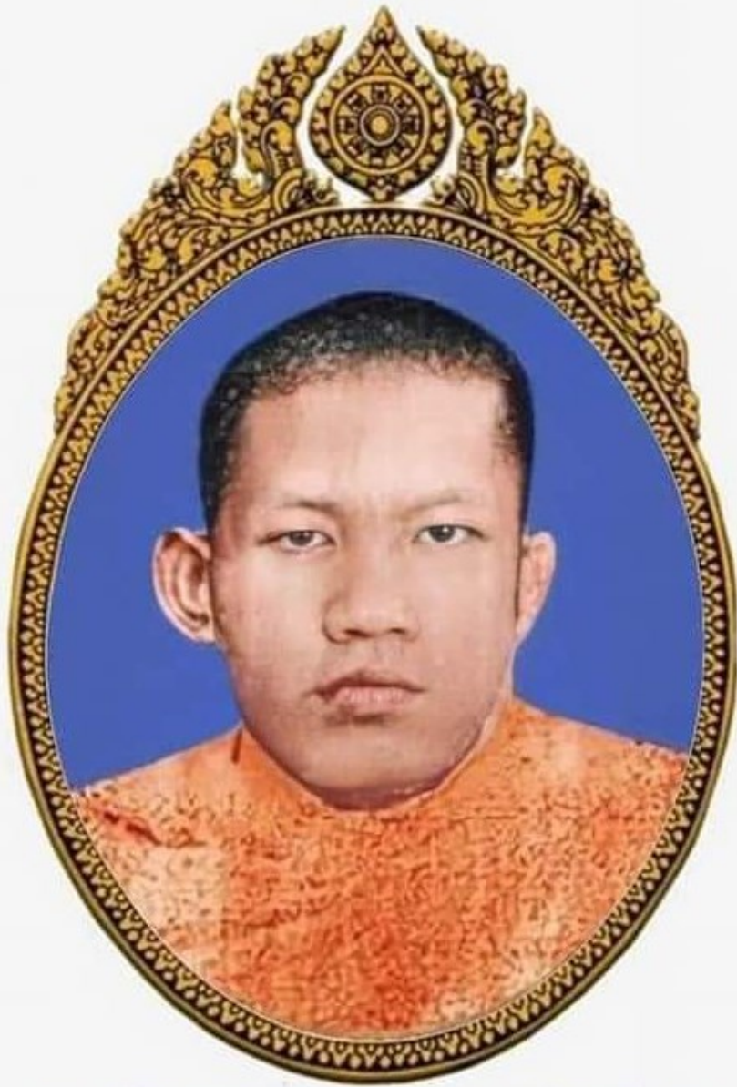
ព្រះសិវេសម្មតិវង្ស គង់ គូ បិយសីលោ អតីតចាងហ្វាងពុទ្ធិកវិទ្យាល័យព្រះសុរាម្រឹត និងជាក្រុមជំនុំប្រែព្រះត្រៃបិដកខ្មែរ